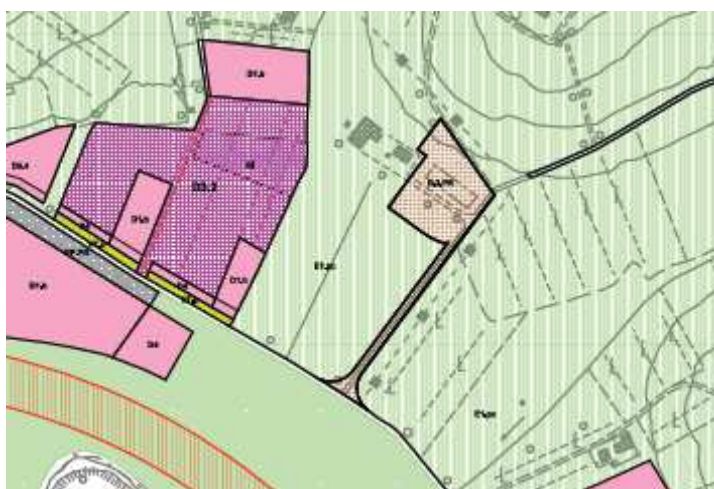
Estratto R.U. Tav. PR5

Con l'attuazione dell'intervento sopra descritto si dovrà inoltre provvedere alla realizzazione dell'allargamento della strada pubblica (Via Avanella - Scafati) secondo quanto indicato negli elaborati del R.U.. La realizzazione degli ampliamenti sopra descritti è subordinata alla presentazione di specifico Progetto Unitario Convenzionato (PUC), completo dei nulla osta degli enti gestori dei servizi e stipula di convenzione con l'Amministrazione a garanzia della realizzazione delle opere di urbanizzazione primaria.